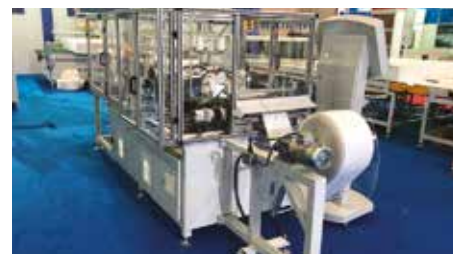
02 Robust Sewing Heads with Automatic Lubrication Otomatik yağlamalı zincir dikiş JUKI dikiş kafaları