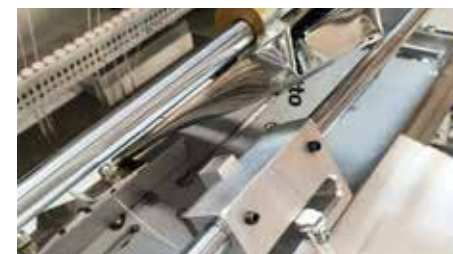
03 Various attachments for special borders Sayısız opsiyonel avara sistemiyle çok farklı kombinasyonlarda bordür yapabileme.