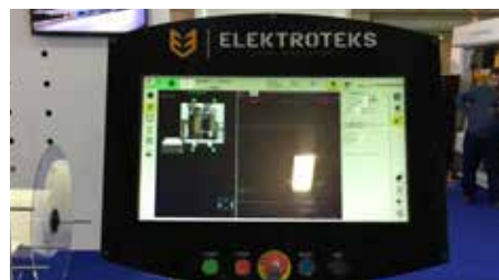
01 Easy Border Design Creation Kolay Yan Bordür Deseni Çizim Sistemi