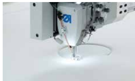
01 Heavy Duty Durkopp Adler 867 Sewing Head with 32mm XXL Bobbin

Genişlik Ayarlı, Çift Katlı Kasnak Hazırlama Masası