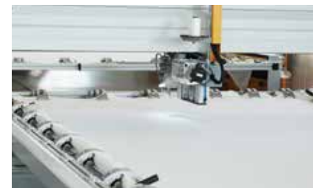
03 Automatic Frame Measure Control System