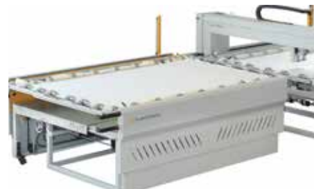
02 Frame Change within 15-20 Seconds with the Preparation Table

Dünyaca bilinen yüksek kalite dikiş kafası: Durkopp Adler